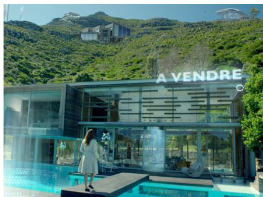
Cliquez sur l'image pour voir la vidéo 1

Les deux films de la campagne TV ont été réalisés par Jan Kouwen qui a porté un véritable regard cinématographique sur Boursorama Banque, conférant à cette prise de parole une dimension à la fois spectaculaire et sympathique.