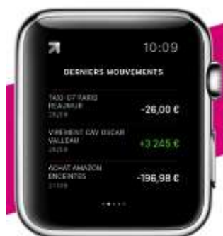
Nouvelle appli également disponible sur l'Apple Watch