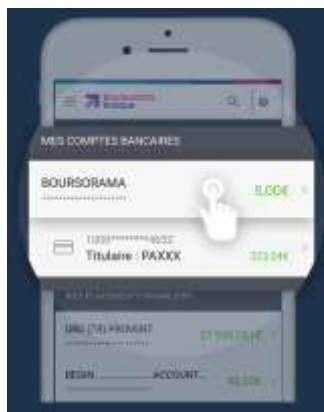
Affichage rapide de la liste des opérations avec 3D Touch (sur IOS) ou Long Touch ID (sur Android)